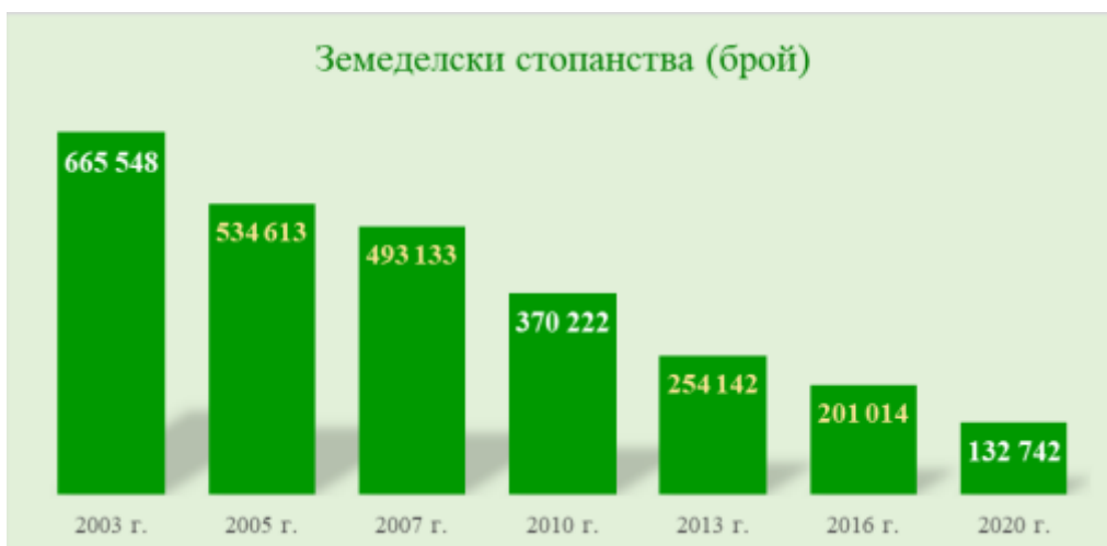
Фигура 6. Брой земеделски стопанства