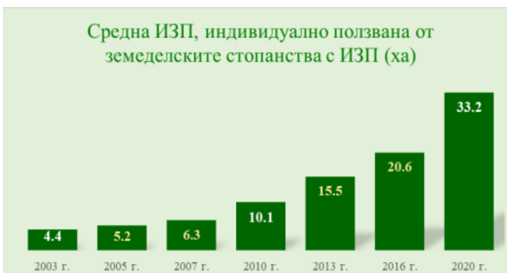
Фигура 7. Средна ИЗП, ползвана индивидуално от земеделски стопанства