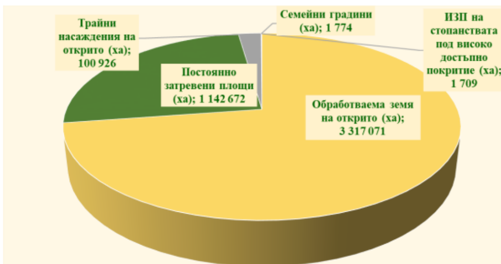
Фигура 13. Данни за обработваемата земя

Статистиката проследява обработваема земя на открито (73% от общата ИЗП): 25% - постоянно затревени площи, 60% - зърнено-житни култури, 31% - технически, 26 825 ха - пресни зеленчуци.