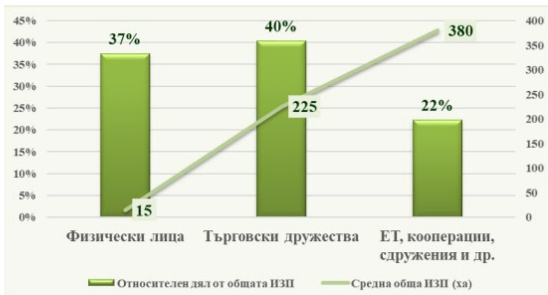
Фигура 9. Стопанисване от общата ИЗП

За проучвания период е видно, че земята се стопанисва предимно от търговски дружества и физически лица, а 22% от общата ИЗП от еднолични търговци (ЕТ), кооперации и сдружения и други юридически форми.