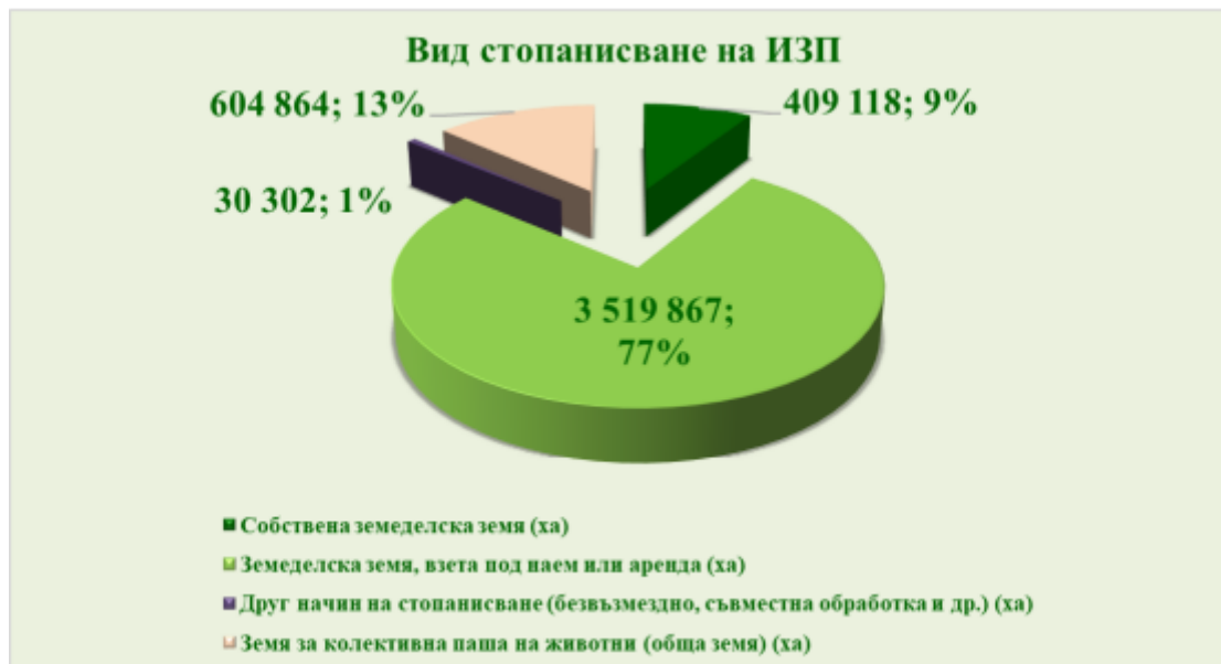
Фигура 12. Вид стопанисване на ИЗП

Отчита се, че през 2020 г. само 9% от общо използваната земеделска площ е собствена земя.