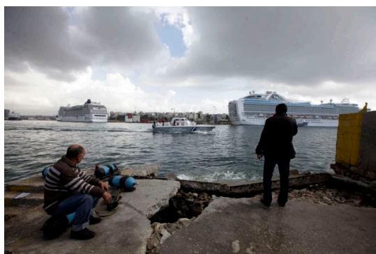
Фиг. 1 Спазване на дистанцираност на островните пристанища

IAPH, BIMCO, IACS, IFSMA, IMPA, INTERTANKO, P&I клубове, CLIA, INTERCARGO, InterManager, IPTA, FONASBA и WSC, и които също вземат предвид приноса на Международния съвет на морските работодатели (ИМЕС) и Международната асоциация на собствениците на кораби за подкрепа (ISOA). Държавите-членки и международните организации се приканват да използват приложените насоки и да ги разпространяват сред съответните национални органи, които отговарят, за морските въпроси, здравеопазването, митниците и др. имиграция, граничен контрол; и да се свърже със съответните национални органи, според случая, по отношение на използването и прилагането на противоепидемичните мерки“