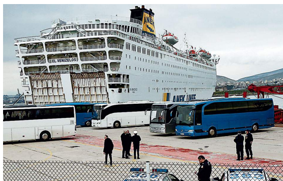
Фиг.2 Санитарни и медицински прегледи на пасажери и членове на екипажите.

„Мерките, които предприехме в миналото, бяха от решаващо значение, защото успяхме да намалим броя на случаите на корона на островите до минимум. Много острови в момента нямат абсолютно нищо“, каза г-н Йоанис Плакиотакис, временно изпълняващ длъжността председател на партия „Нова демокрация“ и депутат в гръцкия парламент.