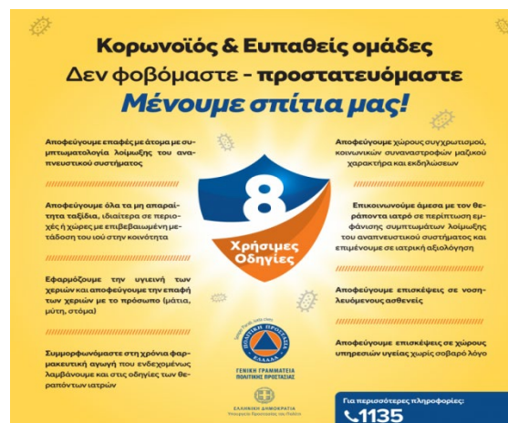
Фиг. 3 Писмени указания за спазване на протиепидемични мерки на гръцки пристанища

Цялата морска система на Гърция беше снабдена със средства за индивидуална защита на хората на първа линия в случай появяване на зараза, както и със средства за оказване на първа медицинска помощ.