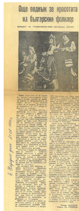
Бакалов, Феодор. Още веднъж за красотата на българския фолклор: Концерт на професионалния ансамбъл “Варна”. // Нар. дело (Варна), XXXVII, N 135, 21 авг. 1980, с. 4.