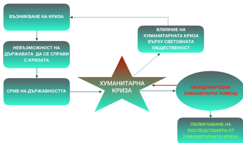
Фигура 2. Хуманитарна криза.

Следва да се отбележи, че при възникване на хуманитарна криза, основният инструмент, с който е възможно да се облекчат последствията от нея и да се окаже помощ на населението, е международната хуманитарна помощ. Също така е необходимо да се има предвид, че последиците от дадена хуманитарна криза могат да оказат влияние върху световната общност, както и да засегнат пряко и косвено определни страни. По своята същност това е и една от характеристиките на хуманитарната криза, които за целите на настоящата разработка следва да бъдат изведени.