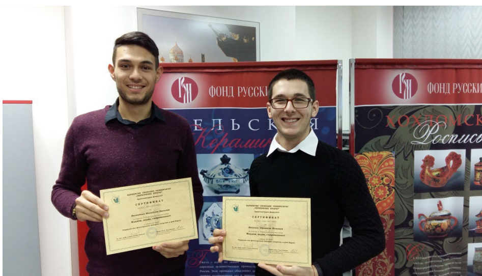
Удовлетворение след отличната оценка от научното жури