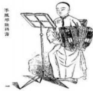
Фиг. 2. Седнала поза за свирене на акордеон

Акордеонът, използван в тази книга, е диатоничен, и е същият като този в най-ранния учебник по акордеон в Китай „Самостоятелно обучение по акордеон“. Разликата е, че в „Учебник по акордеон“ се използва опростена музикална нотация, докато книгата „Самостоятелно обучение“ използва японска нотация за този инструмент. Авторът обяснява в „Тълкуване на опростена музикална нотация“ следното: „Музикалната нотация на акордеон в западните страни използва системата с петолинии. Но тя е трудна за разбиране от начинаещите. Япония използва числа и добавя някои щрихи..“ Но недостатъкът на този метод е, че „въпреки че е лесен за разпознаване, той не е подходящ за пеене“. „Наскоро публикуваните учебници по орган в Китай обикновено използват опростени означения с арабски цифри за записване на ноти.“ (От това можем да направим извода, че когато авторът е редактирал тази книга, вече е имало учебник по акордеон, публикуван в Китай, и неговата редакция и дата на публикуване не може да бъде по-рано от 1903 г. 2 ). Ето защо, всички военни песни и танцова музика, преведени и редактирани от автора, са отбелязани с „опростени музикални ноти“, отбелязани с арабски цифри(фиг. 3). В допълнение авторът счита, че много китайски опери “кунцю” 3 , както и народни