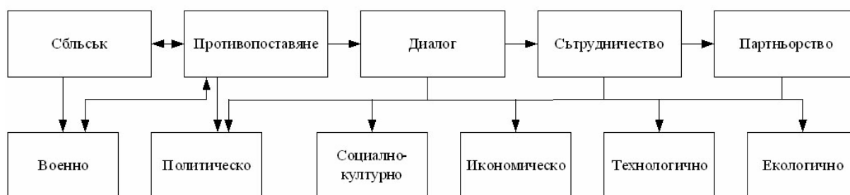
Фиг. 1. Форми и сфери на взаимодействие на локалните цивилизации

2. Противопоставяне между цивилизациите в геочивилизационното пространство (което може да продължи столетия). Това е противоборство, което понякога прераста в конфликти. (Противопоставяне съществува между евразийската и западната цивилизация по време на Студената война и то се съпровожда с непреки сблъсъци, например в Корея и Виетнам ).