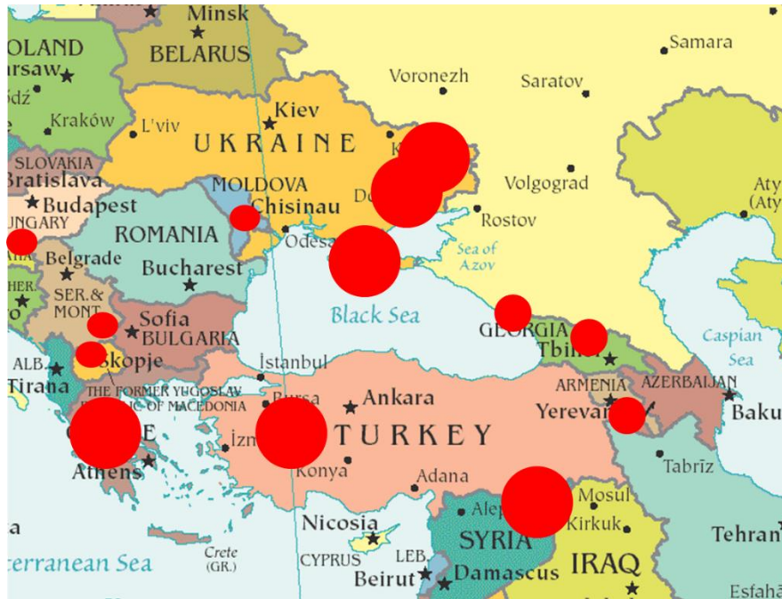
Фиг.1 Зони на риск за стабилността на Черноморския регион

От стратегическа гледна точка Черно море има важно значение за европейската сигурност. Това значение произлиза от транзитния характер на региона по отношение преноса на енергоносители между Каспийско море и Европа. То също така, е потенциален канал за нелегален трафик на хора, наркотични вещества, оръжие, а също и изходна зона за развърщане на военноморски способности (в частност за Русия) 5 . Комбинацията от тези фактори и близостта на ЕС определя интереса към процесите в него. Те директно влияят върху диверсифицирането на енергийните транспортни